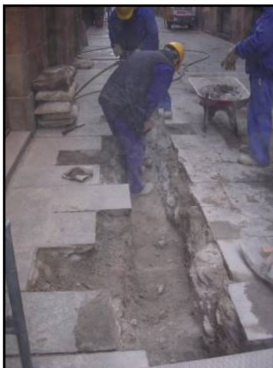
Foto.2: Detall dels treballs d'extracció del formigó en el tram de rasa del carrer de les Cabres.