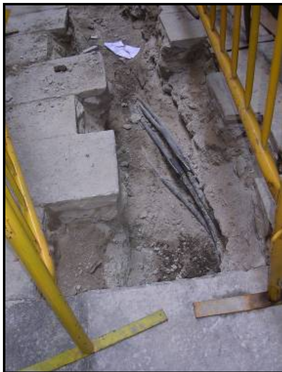
Foto.7: Detall dels serveis existents a la zona del carrer de les Cabres.