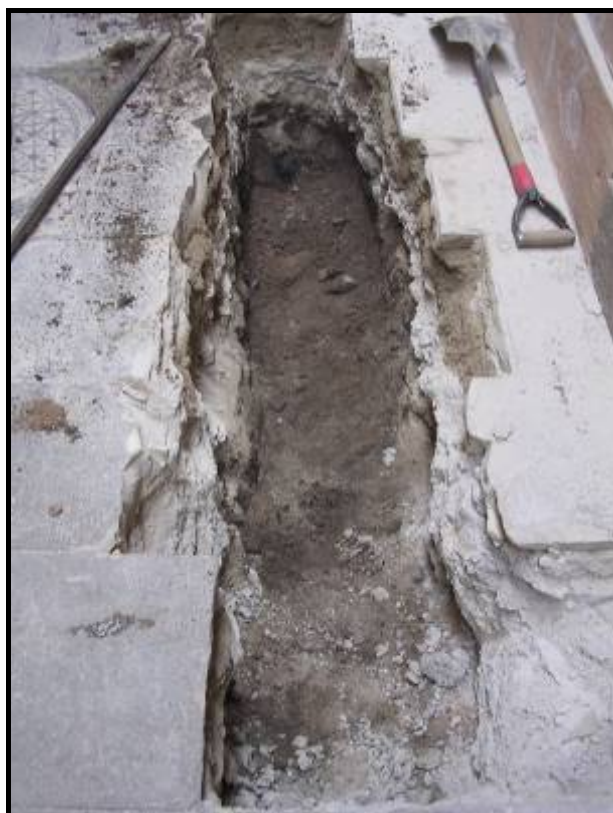
Foto.6: Detall de la rasa del carrer de les Cabres un cop oberta.