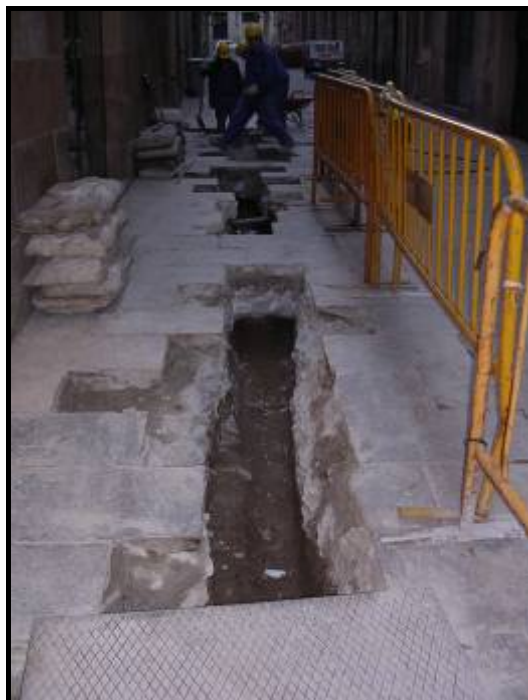
Foto.5: Detall del tram de rasa del carrer de les Cabres ja finalitzada.