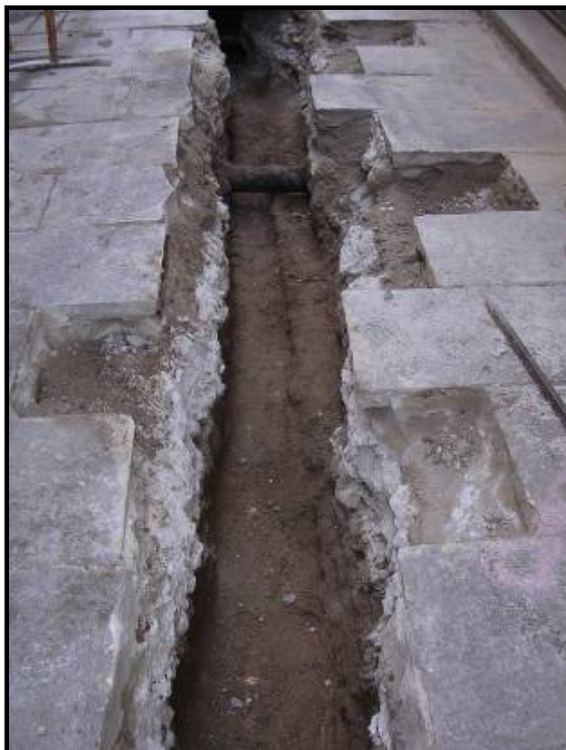
Foto.3: Detall del tram de rasa del carrer de les Cabres un cop oberta.