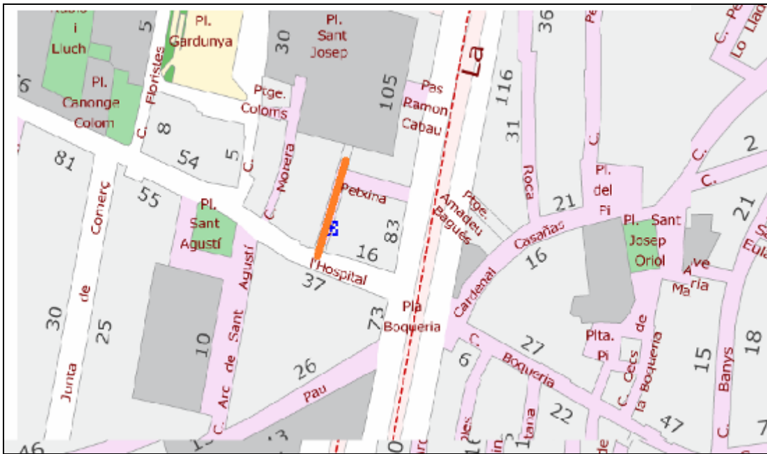
Plànol 2: Situació de la rasa del carrer de les Cabres